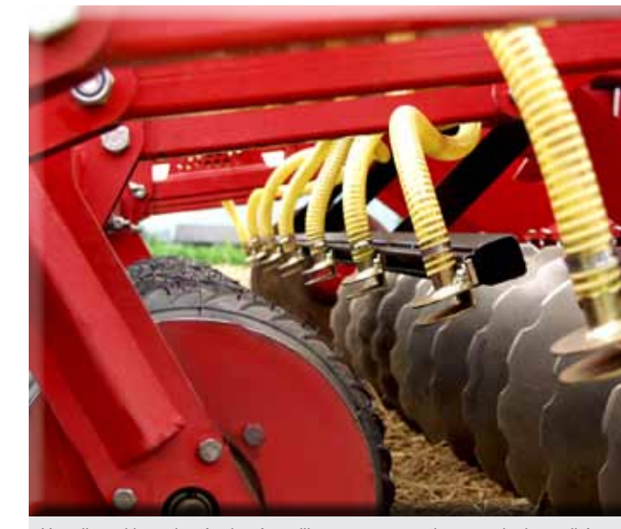
Une disposition adaptée des épapilleurs pour garantir un semis de qualité