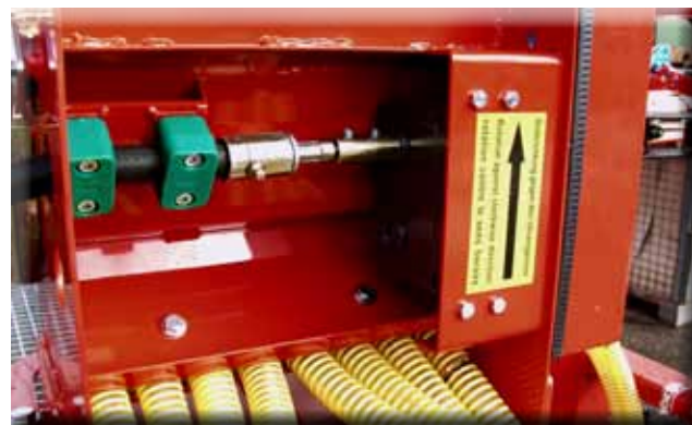
L'entraînement se fait par la roue de terrage - cable flexible (Ø=12mm), transmission

Le Semoir Air 8, d'un volume de 150 litres, est équipé de deux ventilateurs avec moteur électrique de 12 volts, les semoirs Air 16 (trémie 400 litres) et Air 24 (trémie de 650 litres) ont un ventilateur entraîné par moteur hydraulique. La semence est transporté via le rouleau de dosage (interchangeable) dans le 8, 16 ou 24 compartiments, et est propulsé par l'air dans les tuyaux sur les épapilleurs. Pour chaque descente il y a un compartiment. Pour cela il y a une distribution exacte de semence sur toute la surface. L'entraînement se fait sur une roue de terrage et cable flexible (seulement sur Air 8) sur une transmission à réglage en continu, ou roue de terrage avec capteur, qui envoie les impulsions à un moteur électrique. Les deux systèmes permettent un débit semences de 3-400kg (selon largeur, les graines semées et rouleau de dosage utilisé). Avec la transmission, le réglage de débit se fait manuellement, avec l'entraînement par moteur électrique, le réglage peut se faire du siège du tracteur. Un mélangeur apporte la semence en contact avec le rouleau de dosage. Pour les petites graines on peut changer de rouleau avec les grandes cannelures contre un autre avec des petites.