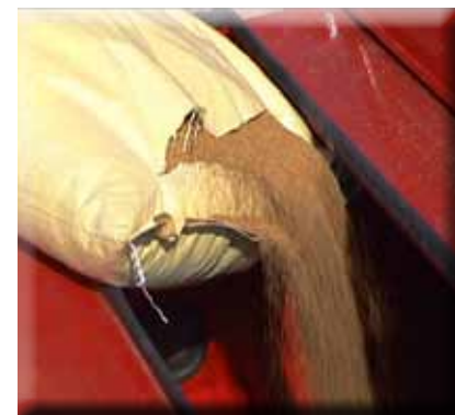
← Air 8 remplissage de trémie (large couvercle et fenêtre)