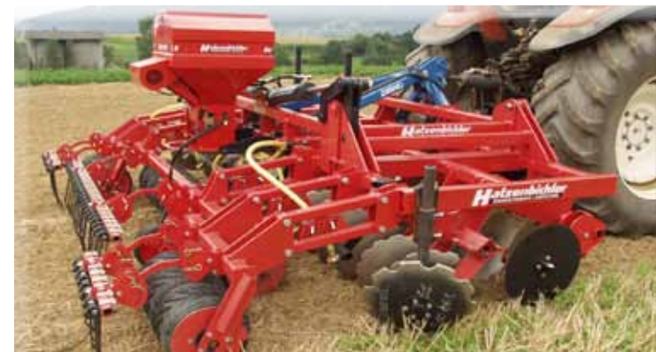
„Air 8“ monté sur „Disko“, semis engrais verts ou semis herbe