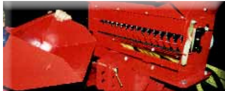
Bac de débit pour Air 16