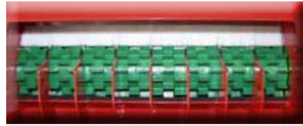
Rouleau à cannelures pour assurer une régularité du semis