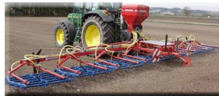
„Air 16“ aufgebaut auf 15m Striegel, für Ein- Nach- oder Untersaat