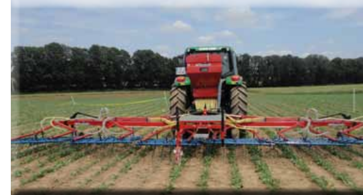
„Air 16“, monté sur Herse-Etrille 9m de large (sursemis etc.)