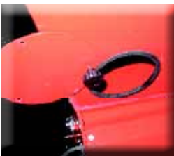
Vidange du fond de la trémie