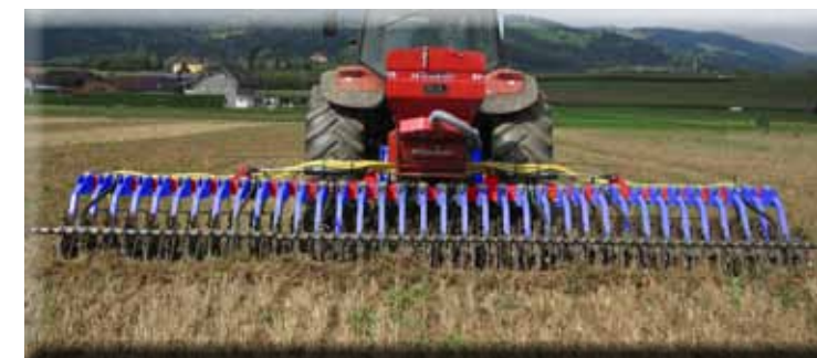
„Air 16“, monté sur houe-rotative 6,40m