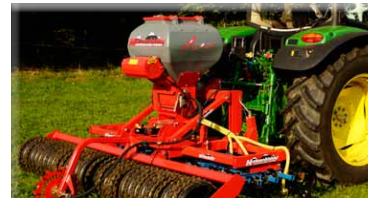
„Air 8“ monté sur „Delta“, semis engrais verts