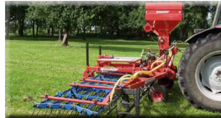
„Air 8“ monté sur Herse-Etrille 4,50m (semis dans céréales)