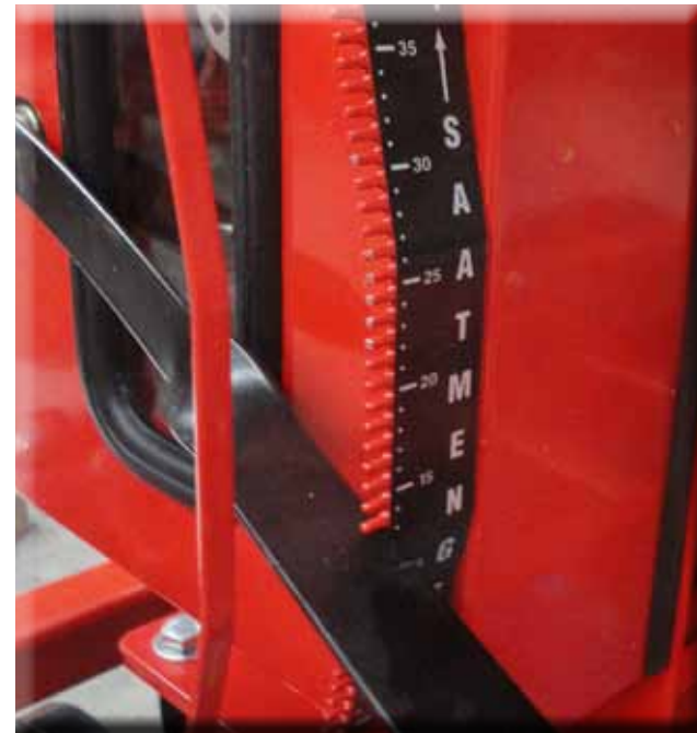
Le réglage de débit est fait manuellement