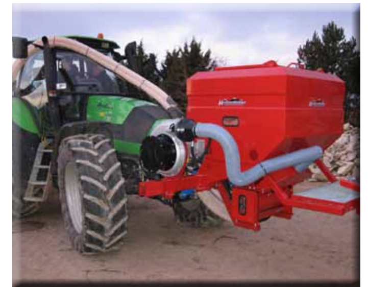
Hatzenbichler „Air 16“ avec 400 L Réservoir équipé d'hydraulique Lecteur de ventilateur et commande électronique