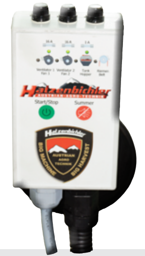
Suivi ordinateur „Air 8“, le niveau, le ventilateur, la surveillance de la ceinture