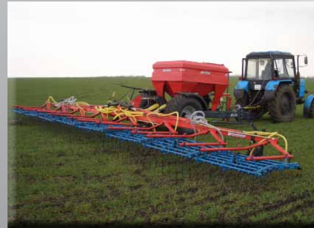
Herse-Etrille 12m avec Air Cart Trailer TH 300 capacité 3000 litres.