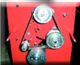
Moteur électrique à vitesse variable entraine le rouleau à cannelures