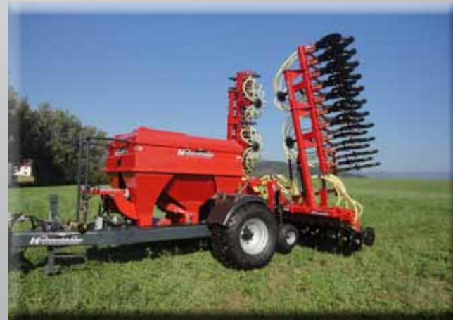
Hornet Semoir avec Air Cart Trailer TH 300 capacité 3000 litres.