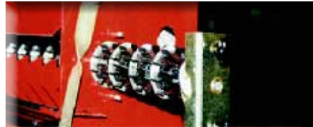
Rouleau à grosses cannelures