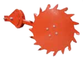
La roue de terrage avec capteur fournit les impulsions au moteur électrique