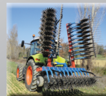
Largeur de transport inférieur à 3 mètres.