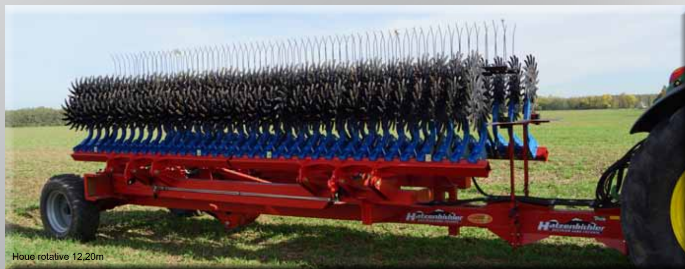
Houe rotative 12,20m