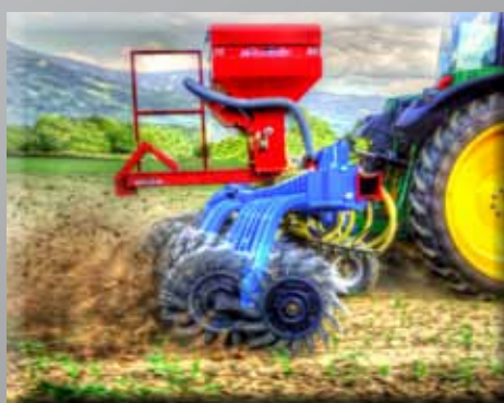
Houe rotative 6,40m avec "Air 16"