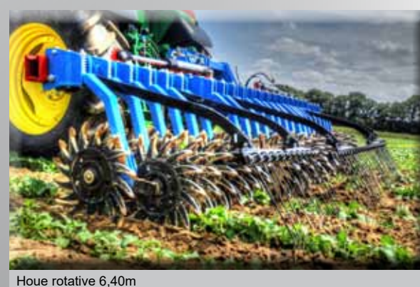
Houe rotative 6,40m