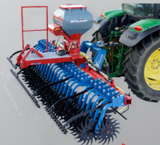
La houe rotative 6,40m avec "Air 8"