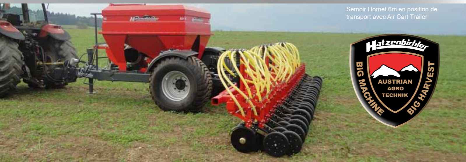
Semoir Hornet 6m en position de transport avec Air Cart Trailer