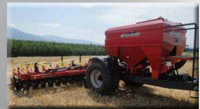
Semoir Hornet 6m en position de travail