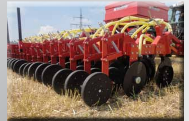
Hornet 6000s avec Air Cart Trailer