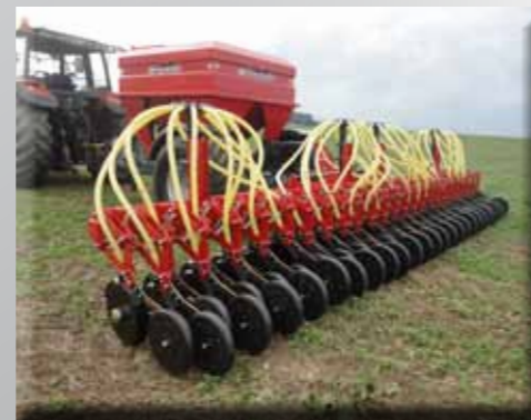
Semoir 6m.Hornet avec Air Cart Trailer