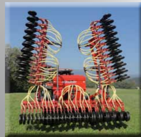
Semoir Hornet avec largeur de travail 9m en position de transport