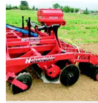
4,00m Disko mit Farmflexdruckwalze und pneumatischem Sägerät «Air 8»