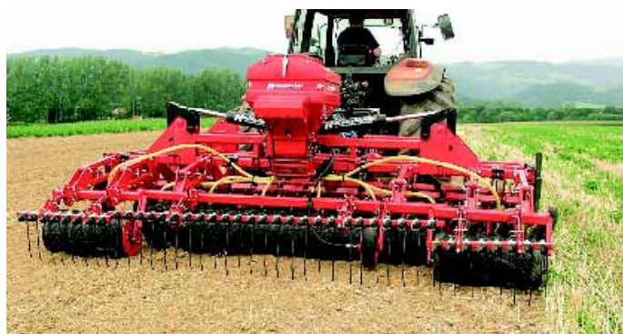
4,00m Disko mit Farmflexwalze, Nachkrümelstriegele und pneumatischem Sägerät «Air 8»