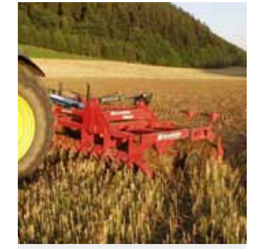
3,00m Disko im Arbeitseinsatz