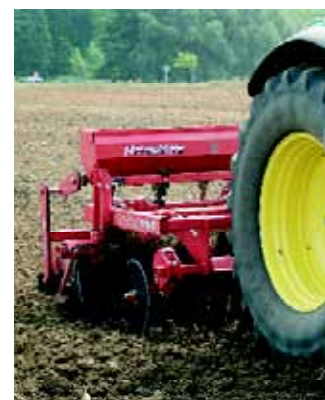
3,00m Disko mit Farmflexdruckwalze Einsatz zur Saatbeetbereitung