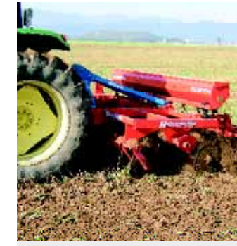
3,00m Disko mit Farmflexdruckwalze, Nachkrümelstriegele und Zwischenfruchtsägerät «Exaktor»