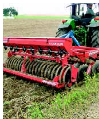
3,00m Disko mit Keilringwalze und Zwischenfruchtsägerät «Exaktor»