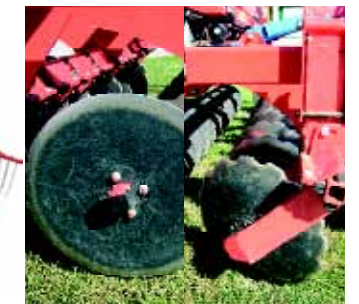
gedeferts und einstellbare Randscheiben geben einen sauberen Abschluss an den Seitenrändern