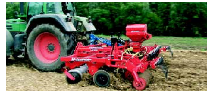
5,00m Disko mit Farmflexdruckwalze, beim Einsatz im gehäckseltem Maisstroh