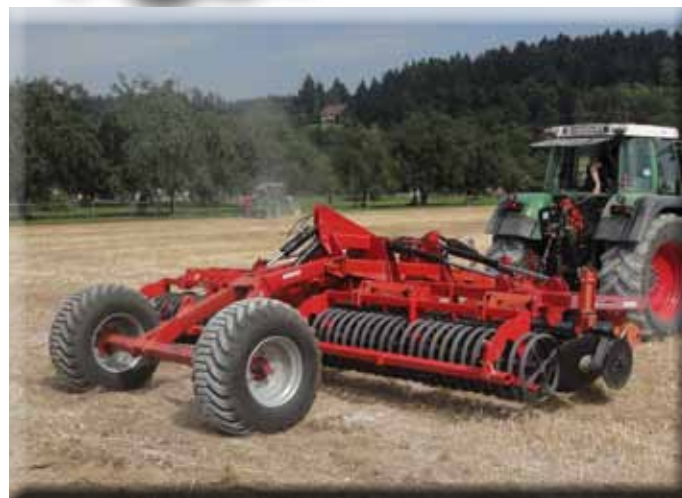
6,00m Disko, Aufsattelausführung im Arbeitseinsatz