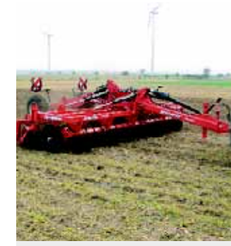
5,00m Disko Aufsattelausführung mit Farmflexdruckwalze und Nachkrümelstriegele