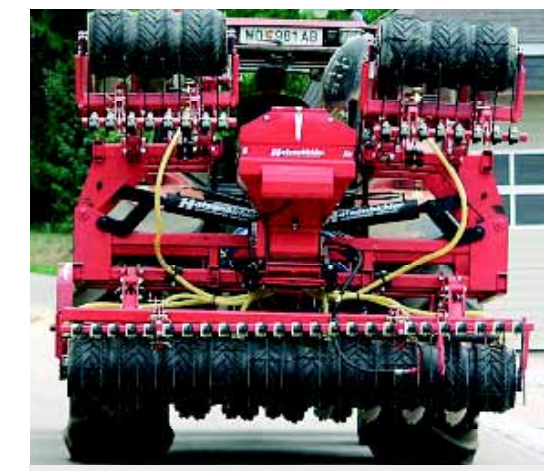
4,00m Disko mit pneumatischem Sägerät «Air 8» in Transportstellung